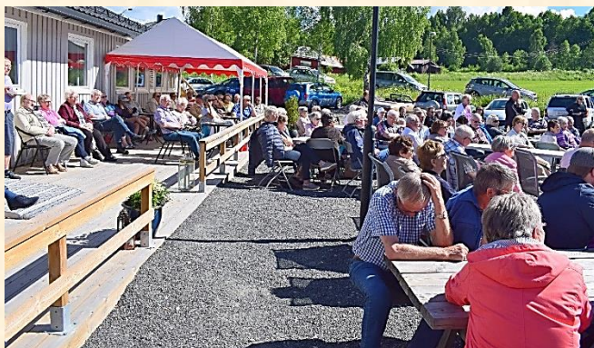
Fra «kulturdagen» 2017.

Nytt av året er at ved å skrive ditt navn i vellets «gjestebok» ved besøk er man med i trekning siste søndagen (12.08) om et gavekort pålydende kr. 1.000,-