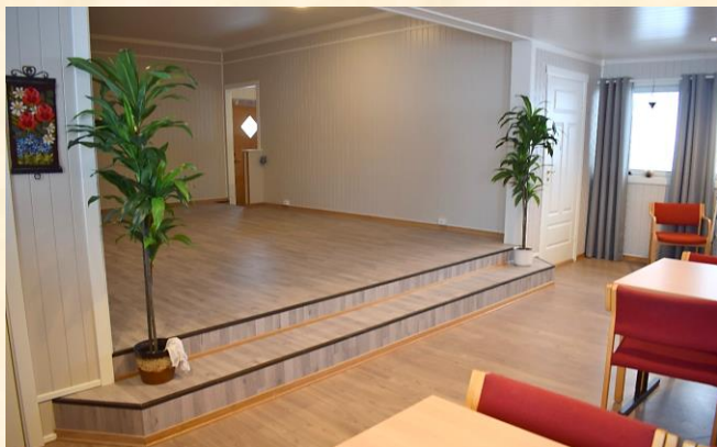
Scena sett fra salen med døra til garderoben til høyre.

Frist for dette arbeidet er satt til 1. september 2018 og utbetaling vil skje i slutten av året. (Ligger i budsjett for 2018).