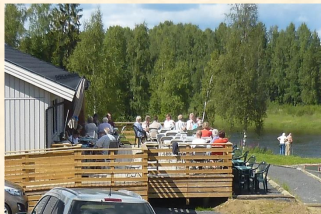
Fra terrassen ned mot Glomma.

Søndag 24. juni fra kl. 13:00 til 17:00 starter vellet sommersesongen med «Søndagsåpent» og salg av middag og «lopper» fra stabburet.