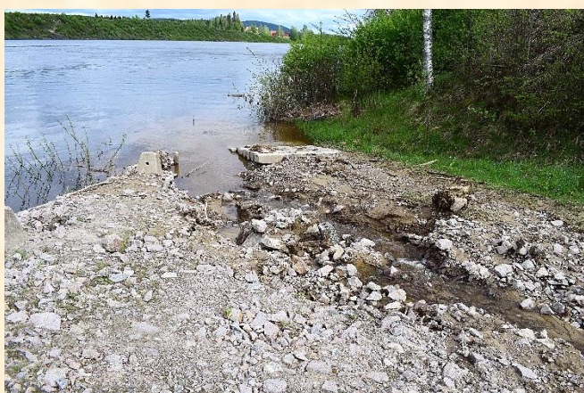
Nede ved elva er det ikke mye som minner om alt arbeidet som har blitt gjort for blant annet å få satt ut båter.

Kjelleren i den «gamle» delen var fylt med vann nesten opp under kjellertaket og hadde forårsaket skade på varmtvannsbereider og det elektriske anlegget.