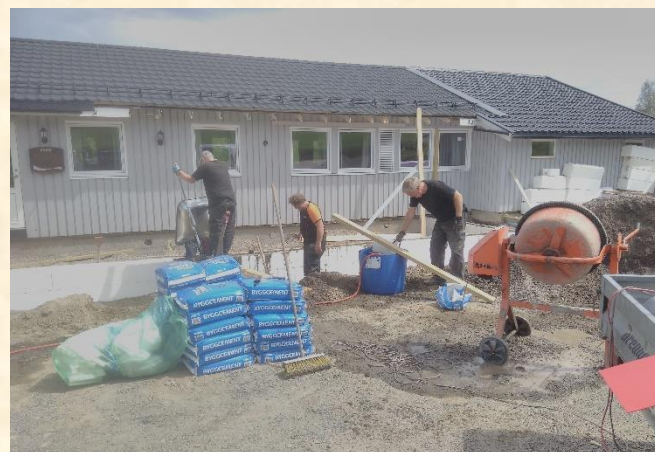
Fra arbeidet med støpingen av ny platting.

Grus, jord og slam samlet seg i store mengder under plattingen.