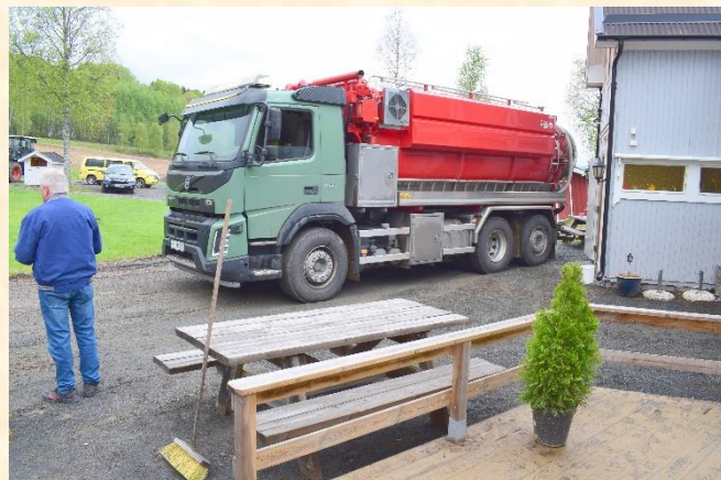
Kolstad Vann og Avløp i gang med å tømme kjelleren.

Kolstad Vann og Avløp ble kontaktet og startet tømning av vann og slam fra kjelleren under «blåstua» i det gamle bygget. Ikke lenge etter ble det igangsatt tørking av kjelleren og krypkjellerene under tilbygget, som fortsatt pågår. Og nok vil pågå en stund framover.