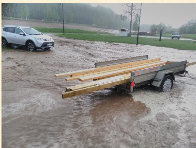
Den søndre nedkjørselen så en periode ut som en elv.

Styrets tilstedeværelse bidro til at man forholdsvis tidlig fikk en overikt over hendelsen og delvis skadene. Som etter hvert skulle vise seg å være mer omfattende enn først antatt.