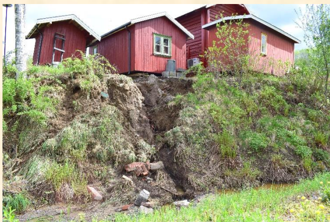
Slik ser det ut på baksiden av «brakka» og utedoen.

Styrets tilstedeværelse bidro til at man forholdsvis tidlig fikk en overikt over hendelsen og delvis skadene. Som etter hvert skulle vise seg å være mer omfattende enn først antatt.