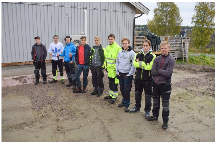
... og den 25. september ankom SVG VK1 Bygg med sine elever