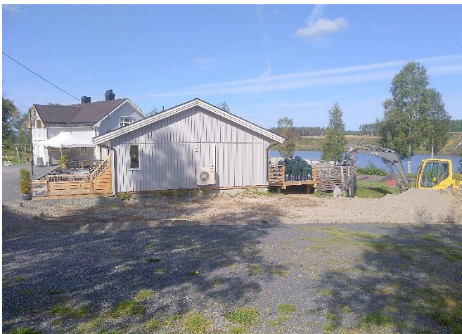
Den 23. august 2017 startet utgravinga av tomta....