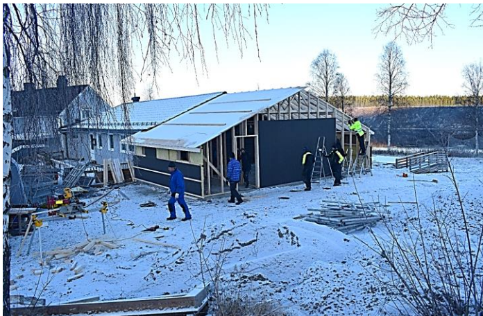
Med god hjelp av elevene ved SVG, så bygget slik ut to dager senere.