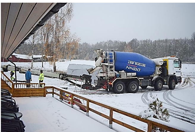
På morgenen den 25. oktober ankom den første betongen....