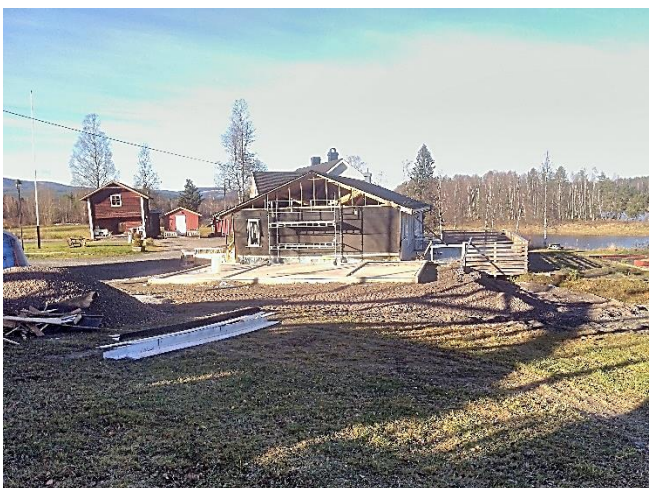
Slik framsto bygget den 2. november 2017.