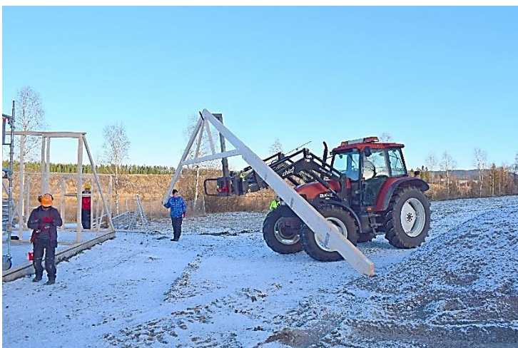
Men den 13. november var reisverket kommet på plass og Jahn Grandal kunne heise de første takstolene på plass.