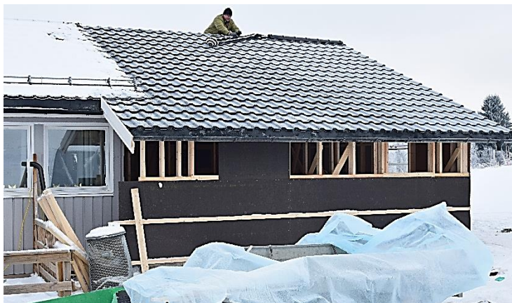
Den 5. desember ble «siste hånd» lagt på yttertaket.