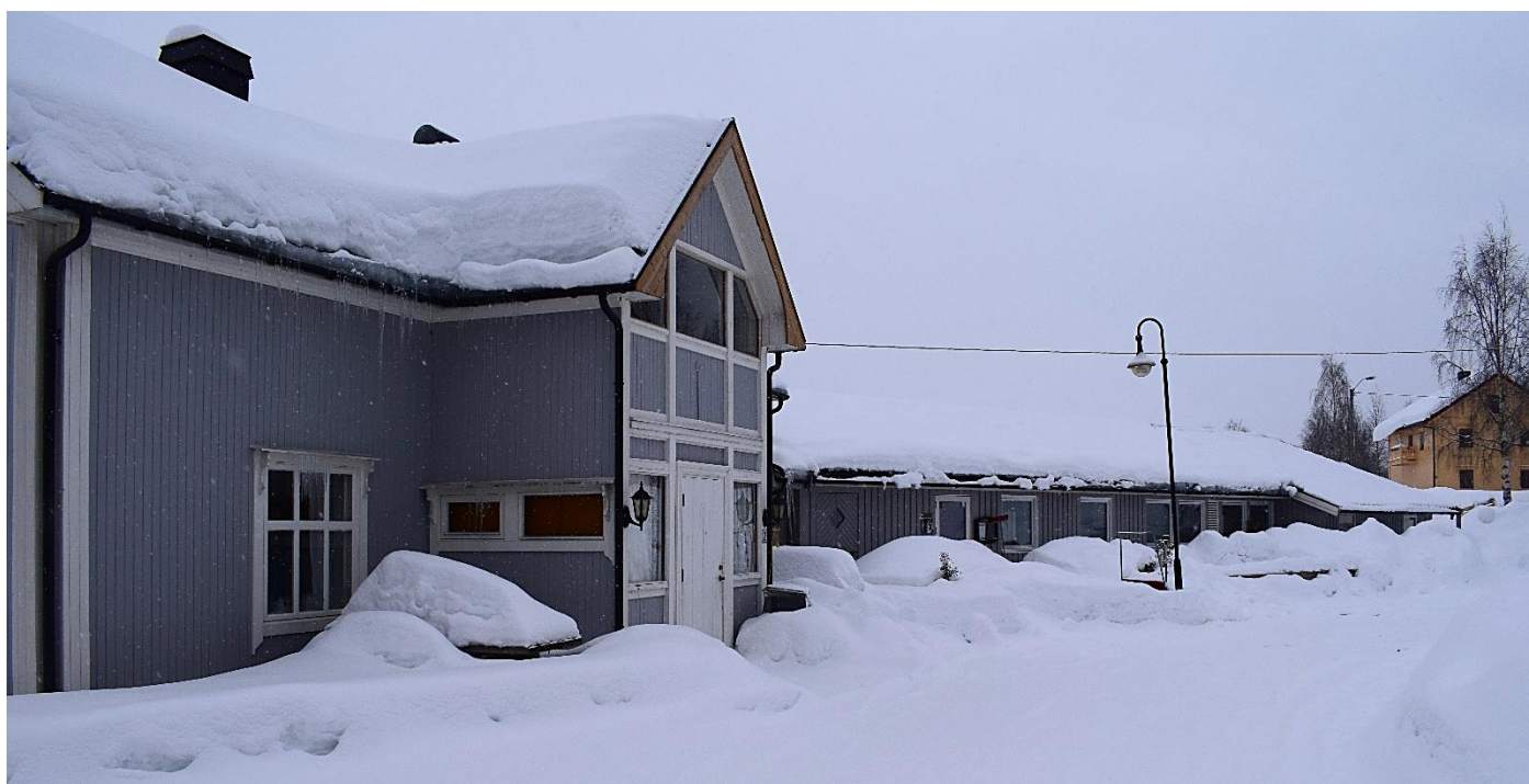
Dette bildet er tatt 16. februar 2018.