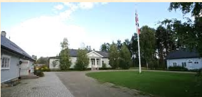
Kommunelokalet med stallen og gamlebanken.